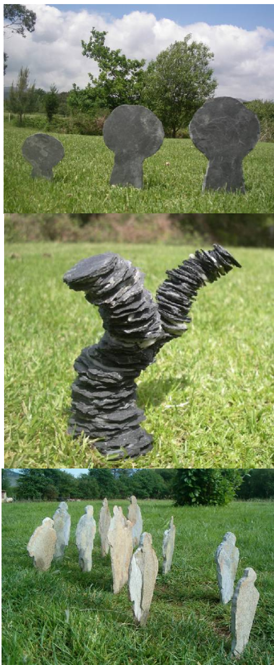
Figura 4. Maquetas de morfotipos de árboles y antropomorfos

La finalidad de esta intervención es dotar al campus de As Pedreiras de un discurso artístico coherente, definir un conjunto espacial simbólico capaz de estimular la función formativa de la universidad, y crear un espacio singular estimado por la comunidad universitaria y por la población en general.