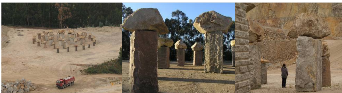
Figura 2. Vistas de la obra

La piedra utilizada procede en su mayoría de la propia cantera en la que se realiza la intervención; el material que extrajo el hombre de la montaña vuelve a ocupar el mismo espacio pero con una forma diferente. En la periferia de la obra también se ha empleado granito rojo y granito negro procedente de África, cuyo color recuerda a los troncos quemados en los incendios. El autor ha querido dar a las rocas un tratamiento infantil y sencillo que nos haga olvidar la carga intrínseca de ese material (dureza, fuerza, dificultad de manejo y trabajo...). Así, el conjunto escultórico está formado por 40 árboles dispuestos en espiral, que pueden llegar a medir hasta siete metros y pesar unas 50 toneladas. El tronco se compone de entre uno y tres bloques rectangulares de granito gris, rojo o negro, y las copas, de color dorado, son piedras irregulares resultado de la alteración natural de las rocas de la cantera.