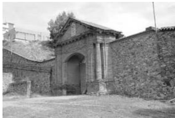
Fotografía 2. Puerta de Carlos IV. Parque Minero de Almadén (Ciudad Real)