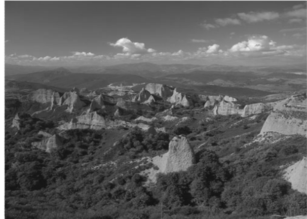
Fotografía 6. Paisaje Minero de las Médulas declarado en 1997 Patrimonio de la Humanidad (León)