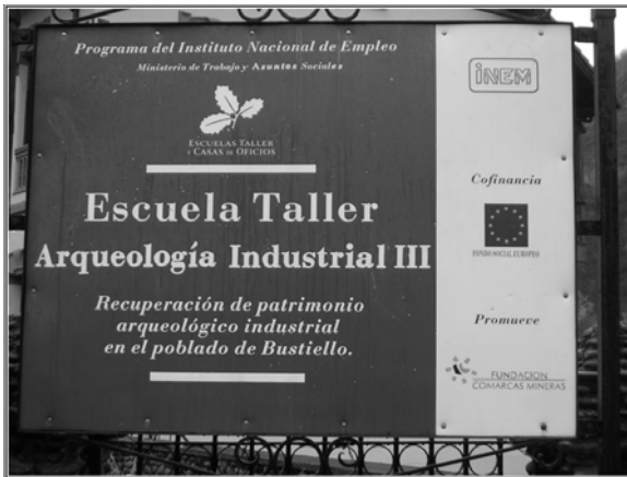
Fotografía 5. Escuela Taller Arqueología III. Poblado Minero de Bustiello (Asturias)