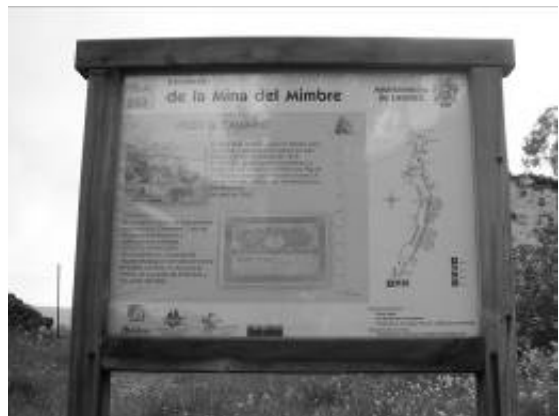
Fotografía 4. Panel Interpretativo de la Ruta Minera de Linares (Jaén). Proyecto Arrayanes