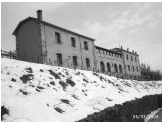
Fotografía 3. Centro de Interpretación de la Minería de Barruelo de Santullán (Palencia)