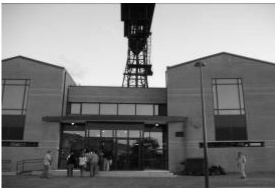
Fotografía 1. Museo de la Minería de Puertollano (Ciudad Real)

que es necesaria la existencia de un agente local que sea capaz de poner en marcha dichas herramientas para poder convertir los recursos culturales en productos y destinos turísticos. Por ello es necesaria la implementación de estrategias adecuadas al respecto. El caso del Programa Cultura 2000 es un ejemplo de herramienta de puesta en valor del patrimonio minero muy representativa puesto que procede de la Unión Europea y por lo tanto es un modelo de referencia para los países miembros en estos temas. El carácter de este programa no sólo es de financiación sino también de planificación, lo que supone un paso más en la implementación de estrategias coherentes de desarrollo de destinos. Tal y como se ha podido observar, prácticamente, en todos los espacios donde se han puesto en marcha acciones del Programa Cultura 2000, también aparecen actuaciones procedentes de otras administraciones, hecho que indica una continuidad en la implementación de medidas de esta naturaleza. Serán necesarios estudios posteriores para analizar el impacto de estas acciones sobre el desarrollo turístico de los destinos especializados en patrimonio minero. Aunque queda todavía mucho camino que recorrer, queda patente el interés que la puesta en valor del patrimonio minero suscita entre las instituciones públicas, europeas y españolas. (Fot. 1-6)