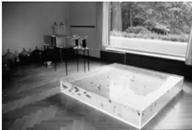
Figura 1: Hans Haacke, Rhine-Water Purification Plant , 1972

Hans Haacke, Rhine-Water Purification Plant , 1972. Se trata de una instalación realizada en el Museo Haus Lange de Krefeld, en donde Haacke dispone agua contaminada del Rin procedente de la planta depuradora de Krefeld. Esta obra, que semejaba un experimento de laboratorio, ponía en cuestión un problema ambiental específico como era la contaminación masiva de las aguas en Krefeld, donde el Rin se había utilizado como receptor de residuos industriales y urbanos. Esta obra se considera el precedente histórico para una constelación de artistas con obras relacionadas con la cuestión de la calidad de las aguas, como son: Betty Beaumont, Jackie Brookner, Tim Collins, Betsy Damon, Reiko Goto, Basia Irland, Stacy Levy, Ocean Earth, Aviva Rahmani, y Buster Simpson.