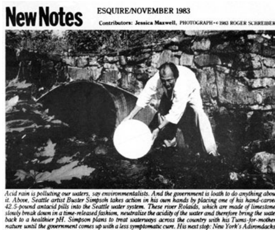
Figura 3: Buster Simpson en la prensa en 1983

En este sentido y tomando como ejemplo las intervenciones del artista norteamericano Buster Simpson, su serie que se inicia en el año 1983, que dura varios años y que consiste en arrojar discos de piedra calcárea a diversos ríos, supone un alineamiento con la sensibilidad ecológica y social respecto a la especial problemática de la acidez de las aguas de los sistemas fluviales del hemisferio norte. Una problemática que se acentúa durante esos años al irse comprobando cada vez con más claridad la relación existente entre las inmisiones de compuestos de azufre y de nitrógeno, con potencial de acidificación de la lluvia y por tanto de las cuencas hidrológicas. Los daños verificados en las coberteras forestales de numerosos lugares de Europa y de Norteamérica junto con los valores decrecientes en la acidez de las aguas son el desencadenante de una importante sensibilización que irá conduciendo a restricciones progresivas a las emisiones de compuestos de azufre y nitrógeno en los sistemas industriales. No es casual que este sea uno de los temas más importantes de la agenda ambiental de la década de los años ochenta. El artista opera como un creador, pero también como un comunicador social, al tiempo que sus acciones, dentro de una metodología artística procesual, provocan una reacción y tienen una repercusión inmediata en los medios de comunicación social, como puede verse en el ejemplo que se acompaña.