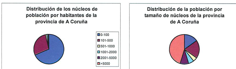
Figs. 2 y 3. Distribución de los núcleos de población y de la población de la provincia de A Coruña por tamaño

Sólo existen 84 núcleos de más de 1.000 habitantes, mientras se elevan a 3.868 los núcleos poblados con menos de 1.000 habitantes. De los cuales 1.162 núcleos se sitúan entre 100 y 1.000 habitantes.